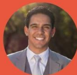
RAPHAEL VASCONCELOS Subsecretario de Trabalho e Emprego na SEDESE/MG EPPGG de MG